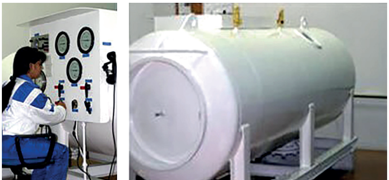
Figura 1. Cámara Hiperbárica del Hospital Naval Raúl Perdomo Hurtado (Catia La Mar, Municipio Vargas, Estado La Guaira, Venezuela) (15).

Existen diferentes tipos de cámara hiperbárica: experimentales, monoplaza (figura 1) (15) y multiplaza (figuras 2A y 2B).