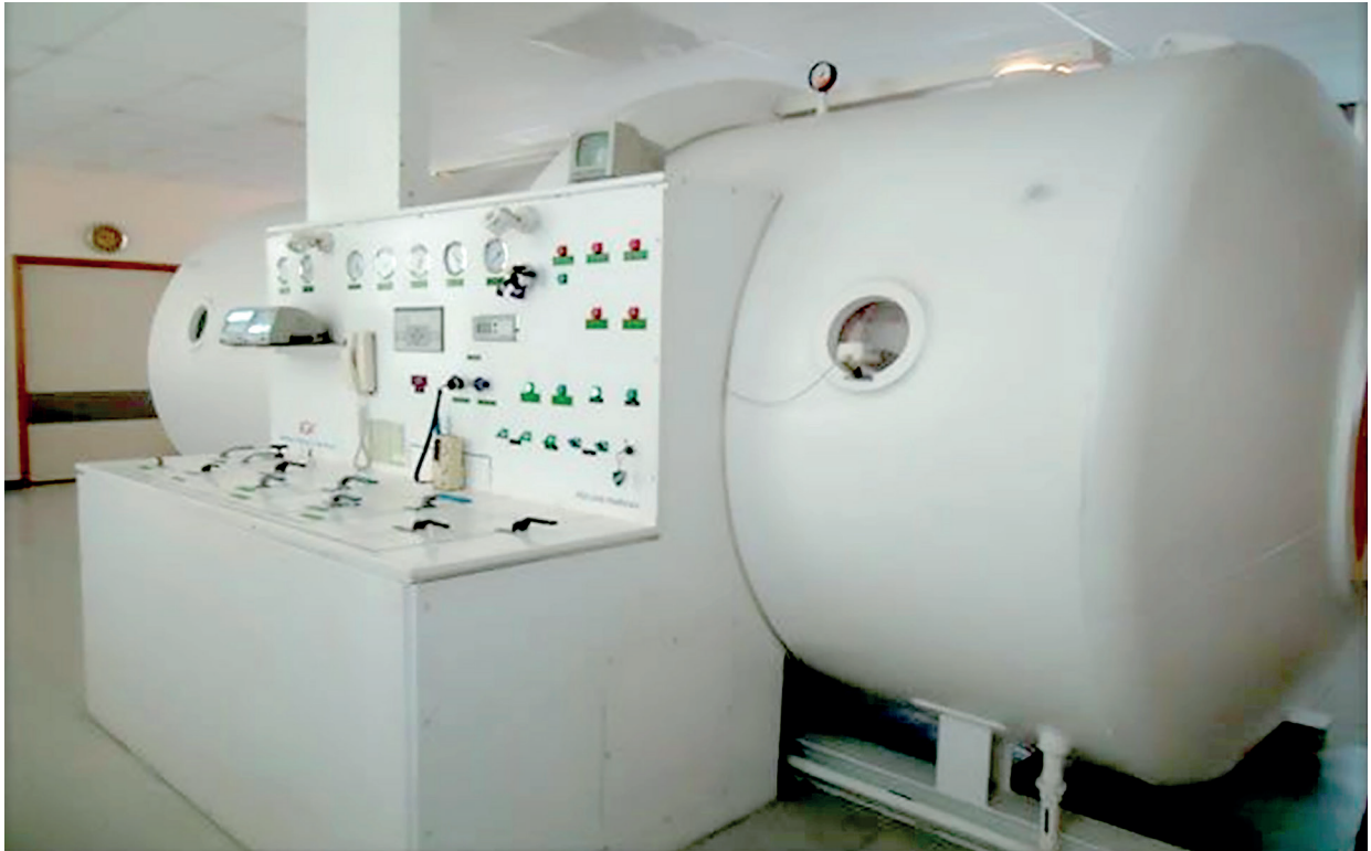
Figura 2A. Cámara hiperbárica multiplaza. Hospital Central de las Fuerzas Armadas, Montevideo, Uruguay.