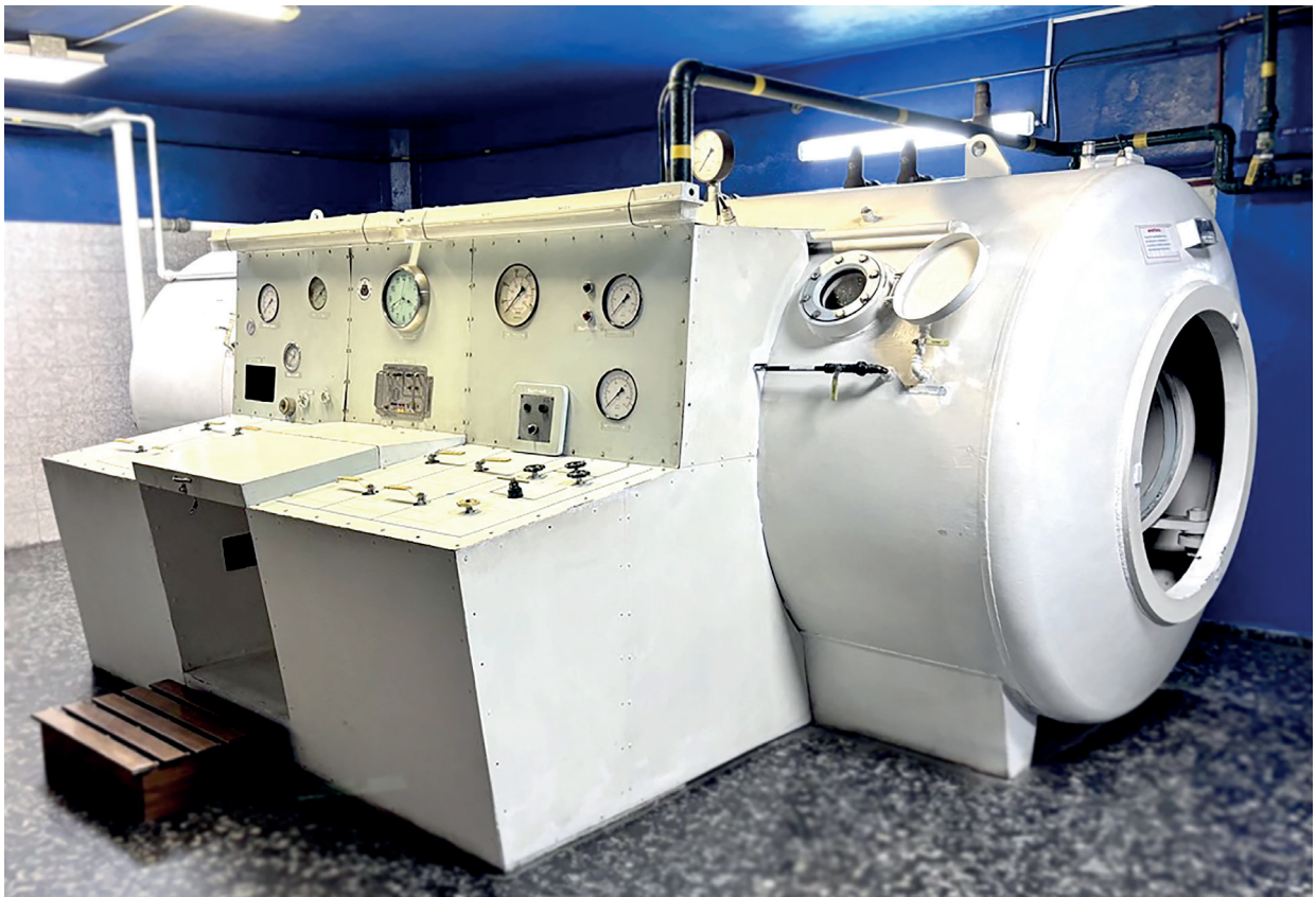
Figura 2B. Armada Nacional. Grupo de Buceo y Salvamento. Montevideo, Uruguay.